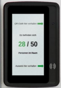
touch.PI mit Chipkartenleser und Kamera

Präsenzveranstaltungen in geschlossenen Räumen wie beispielsweise Vorlesungen oder auch geöffnete Cafeterien benötigen in diesen Zeiten besondere Konzepte: